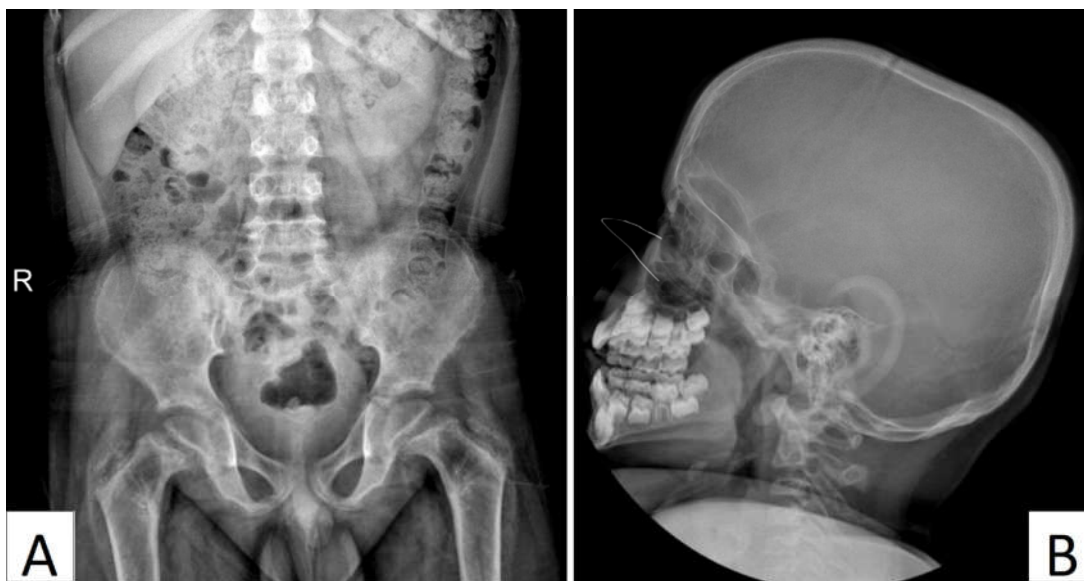
شکل ۴: Subperiosteal resorption در سمفیز پویس و گردن فمور (A)، افزایش ضخامت کالواریا (B)

استخوان، خستگی و اختلالات گوارشی متغیر باشد. ۳ ارزیابی آزمایشگاهی معمولاً سطوح بالای کلسیم سرم و هورمون PTH همراه با سطح فسفات طبیعی تا پایین نشان می‌دهد که تشخیص را تأیید می‌کند. ۴ تشخیص افتراقی هیپرکلسمی در کودکان شامل هیپرکلسمی خانوادگی هیپوکلسیوریک، هیپرکلسمی مرتبط با بدخیمی و مسمومیت با ویتامین D می‌باشد. در تشخیص هایپرپاراتیروئیدیسم اولیه، تمایز میان علل مختلف مانند آدنوم یا هایپرپلازی غده پاراتیروئید ضروری است. ۵ آدنوم‌های پاراتیروئید معمولاً به صورت اسپورادیک رخ می‌دهند، اما ممکن است بخشی از سندرم‌های ژنتیکی مانند نئوپلازی اندوکرین متعدد (MEN) انواع ۱، ۲ A و ۴، سندرم تومور فک-هایپرپاراتیروئیدیسم (Hyperparathyroidism-Jaw Tumor, HPT-JT) و هایپرپاراتیروئیدیسم خانوادگی ایزوله باشند. ۶ روش‌های تصویربرداری مانند سونوگرافی و سیتی‌گرافی با استفاده از ۹۹mTc سستامی، ابزارهای اصلی برای شناسایی آدنوم‌های پاراتیروئید محسوب می‌شوند. ۲ درمان انتخابی برای آدنوم‌های پاراتیروئید، برداشتن جراحی آنها است که معمولاً در برطرف کردن هایپرکلسمی و رفع علائم بسیار مؤثر است (جدول ۱). ۷