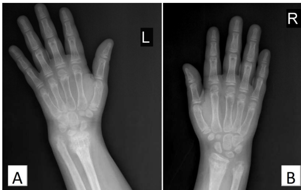
شکل ۲: Bone resorption و دفورمیتی‌های شدید در دیستال استخوان‌های رادیوس و اولنا، جابه‌جایی مفاصل میج دست، افزایش فاصله بین رادیوس و اولنا